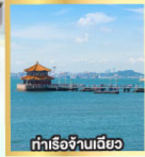
ทำเรือจ้างเดี่ยว