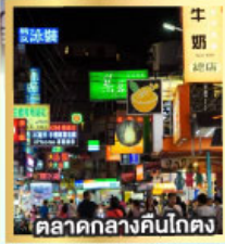
ตลาดกลางคืนโตง