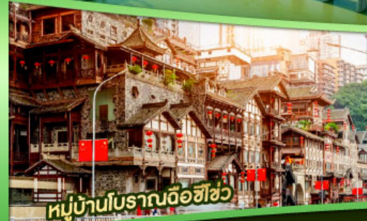
หมู่บ้านโบราณฉือฮิว