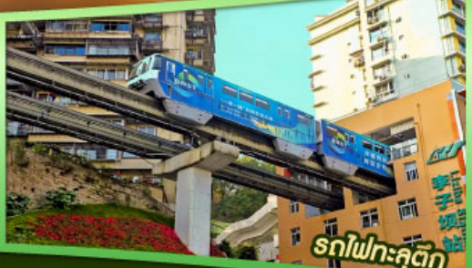
รถไฟทะลุคิ