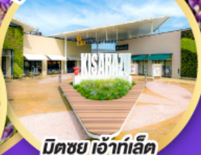
มิตซูเอะอิเกะ พาร์ค คิซึระซุ