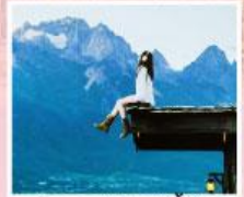
ร้านกาแฟหยุนต๋ออัน