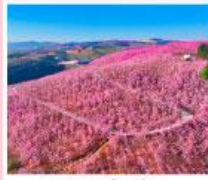
หุบเขาหยี่เหลียง