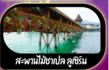
สะพานไม้ชาเปล คูชีริน