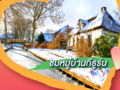
ชมหมู่บ้านกิธูร์น