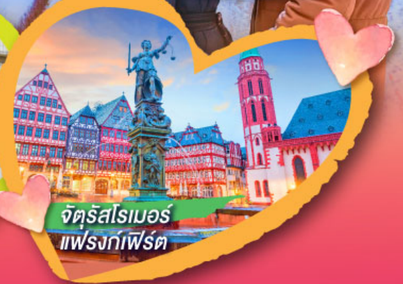
จัตุรัสโรเมอร์ แฟรงก์เฟิร์ต