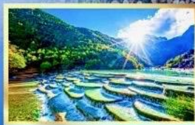
หุบเขาน้ำเงิน