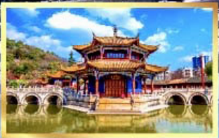
วัดหยวนกง