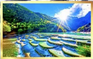
หุบเขาน้ำเงิน