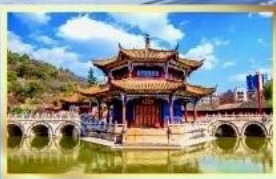
วัดหยวงทง