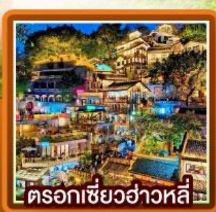
ตรอกเซียวฮ่าวหลี่