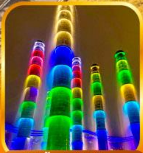
ชมไฟน้ำพุไม้ไฟตึก SKP