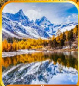
อุทยานปีศาจโกว