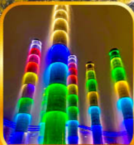
ชมไฟน้ำพุไม้ไฟตึก SKP