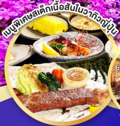
เมนูพิเศษเด็กเนื้อสันในวากิวญี่ปุ่น

พัทช์ไฮโร 2 คืน ระดับ 4 ดาว ไทล์แหล่งช้อปปิ้ง