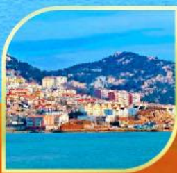
ย่านซาจื่อโข่ว

28 มี.ค.-02 เม.ย. 69 22,900 30 มี.ค.-04 เม.ย. 69 24,900