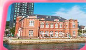
มิจิโกะ เรโอร