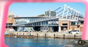
KARATO FISH MARKET