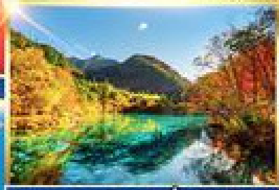
อุทยานแห่งชาติจิ่วจ้ายโกว

เจียงตู - ตูเจียงเจียน - เม่าเสียน - ทะเลสาบเตียนซี ชงฟาน - กำแพงเมืองโบราณชงฟาน - จิ่วจ้ายโกว อุทยานแห่งชาติจิ่วจ้ายโกว - อุทยานแห่งชาติหวงหลง เว่ยลู่ - อุทยานสวรรค์กุมาคิมะการีเซินต้ากู่ปิงชว่น ตึก IFS - ถนนคนเดินชุนซีลู่ - ถนนคนเดินจิ้นหลี่ พิเศษ : สุกีหม่าล่า - มิงย่างบุฟเฟ่ต์สไตล์เจียงตู - สุกีเทบต