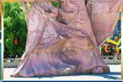
กำแพงเมืองโบราณชงฟาน