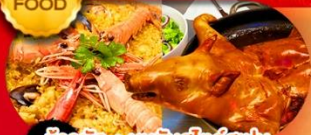
ข้าวมัน+หมูหันสไตล์สเปน