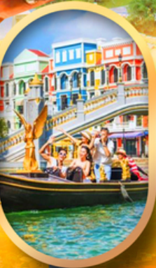
เอนิเมชั่นแห่งเวียดนาม