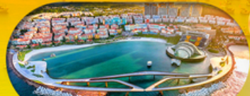
Kiss Bridge สะพานจูบ รวมค่าเข้าสะพานจูบแล้ว