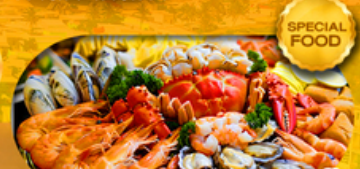
พิเศษเมนู ซิวัดบุฟเฟ่ต์ 1 มื้อ เดินทาง มีนาคม 2569