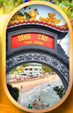
ศาลเจ้าดิงเกา