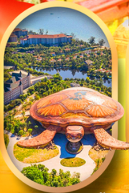
พิพิธภัณฑ์สัตว์น้ำ