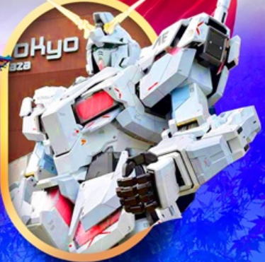
ห้างไอโดบะกันดั้ม