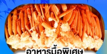
อาหารมือพิเศษ บุฟเฟ่ต์ขาปู