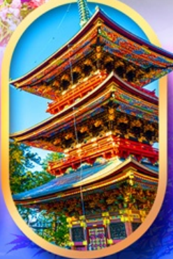
วัดนาริตะจิน