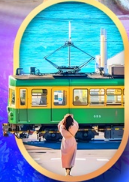
ถนนโคมาจิโคริ