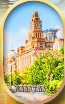
เดอะบิ้นด์