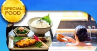
อาหาร JAPAN SET แช่ออนเซนแบบญี่ปุ่น