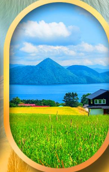
ทะเลสาบโทโยะ