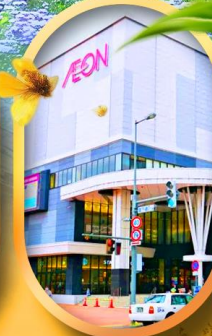
อ็อนมอลล์