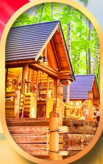
นิงเกิลเทอเรส