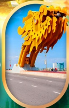
สะพานมังกรคานัง