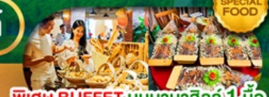
SPECIAL FOOD พิเศษ BUFFET; บันบานาฮิลล์ 1 มื้อ และ SEAFOOD BOAT เดินทาง มี.ค. - ต.ค. 69