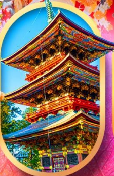
วัดนาริตะ-เซ็น