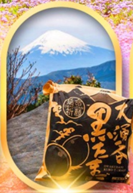
หุบเขาไอวาคุดาบิ