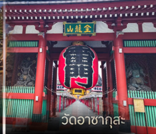
วัดอาสาซุกุสะ