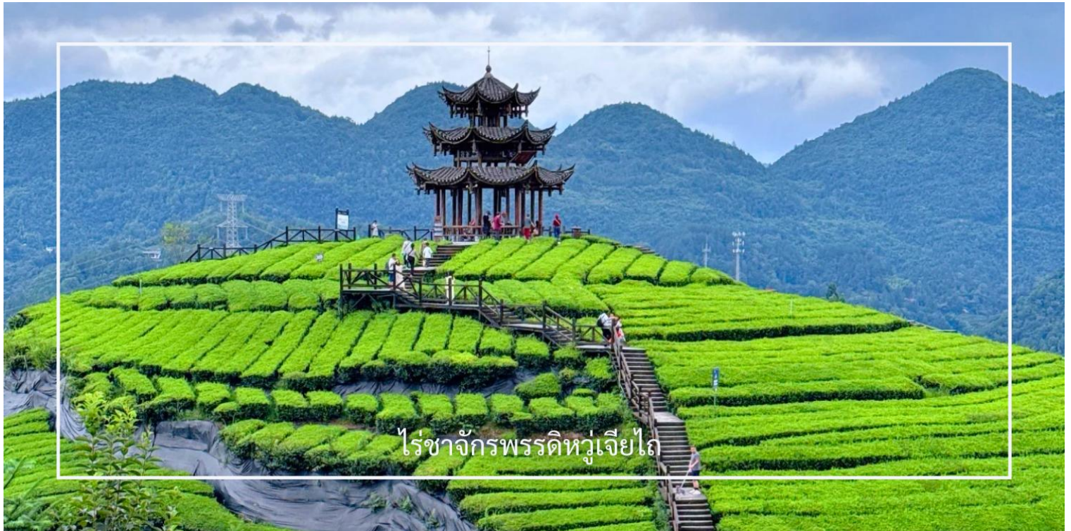
ไร่ชาจักรพรรดิหวู่เจียไถ

จากนั้นนำท่านสู่ ไร่ชาจักรพรรดิหวู่เจียไถ แหล่งกำเนิดชาชั้นเลิศที่สืบทอดภูมิปัญญาการเพาะปลูกและการผลิตมานับร้อยปี ไร่ชาแห่งนี้ได้รับการขนานนามว่า “จักรพรรดิ” ไม่เพียงเพราะคุณภาพของใบชาที่คัดสรรอย่างพิถีพิถัน แต่ยังสะท้อนถึงความสำคัญในอดีตที่เคยเป็นชาที่ถวายแก่ราชสำนัก ภูมิประเทศที่อุดมสมบูรณ์ อากาศเย็นสบาย และหมอกบางที่ปกคลุมตลอดปี ล้วนเป็นปัจจัยสำคัญที่ทำให้ชาจากที่นี่มีกลิ่นหอมละมุนและรสชาติกลมกล่อมเป็นเอกลักษณ์ ให้ท่านได้สัมผัสขั้นตอนการเก็บใบชาแบบดั้งเดิม เรียนรู้กระบวนการแปรรูป ไปจนถึงการชิมชาคุณภาพสูง พร้อมดื่มด่ำกับทัศนียภาพของไร่ชาที่เรียงรายตามไหล่เขาอย่างสวยงาม