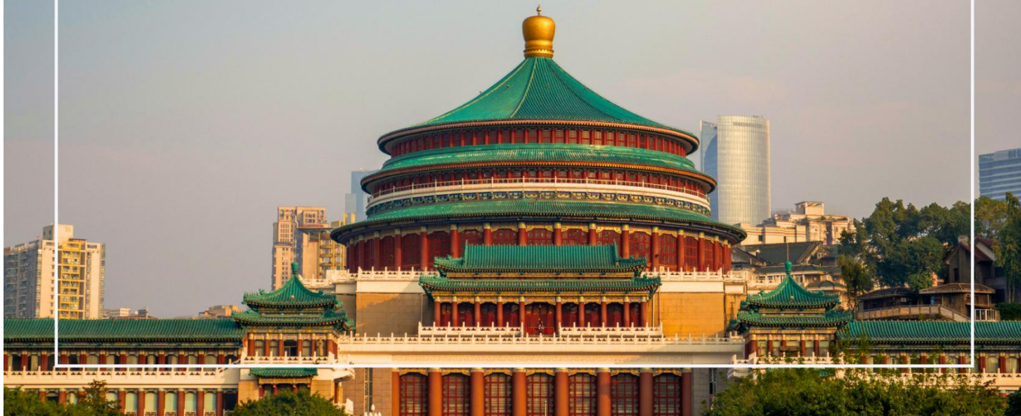
มหาศาลาประชาชนแห่งเมืองฉงชิ่ง (Chongqing People's Grand Hall)

นำท่านเที่ยวชม เมืองโบราณสี่ปาตี (Shibati Ancient Town) ตั้งอยู่ในเขตฉงชิ่ง (Chongqing) เป็นเมืองโบราณที่มีเสน่ห์และเต็มไปด้วยประวัติศาสตร์ อดีตของเมืองนี้ย้อนกลับไปหลายร้อยปี และมีการอนุรักษ์สถาปัตยกรรมแบบดั้งเดิมไว้เป็นอย่างดี เมืองนี้มีบ้านเรือนและอาคารที่สร้างขึ้นในสไตล์จีนโบราณ ซึ่งมีลักษณะเฉพาะที่สะท้อนถึงวัฒนธรรมและประเพณีท้องถิ่น และยังมี ถนนในเมืองโบราณสี่ปาตีที่มีความคดเคี้ยวและเต็มไปด้วยร้านค้า ร้านอาหาร และคาเฟ่ที่ขายสินค้าท้องถิ่น