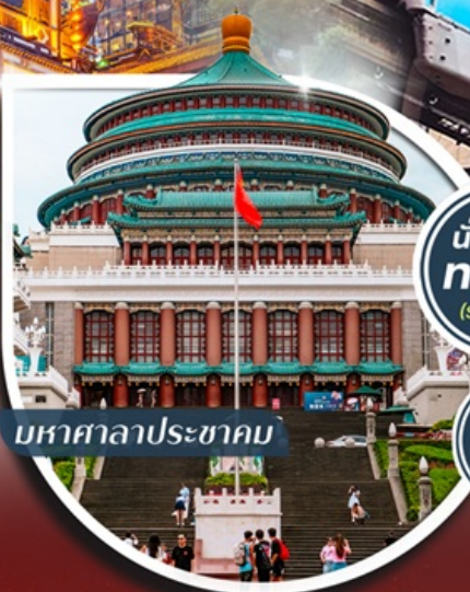
มหาศาลาประชาชน