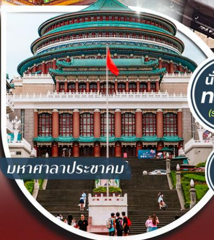
มหาศาลาประชาชน