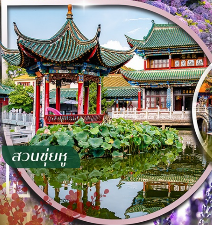
สวนชู่ฮู่