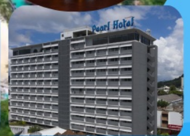
โรงแรมเพิร์ล