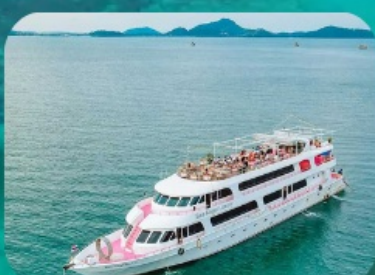
เกาะพีพีทัวร์