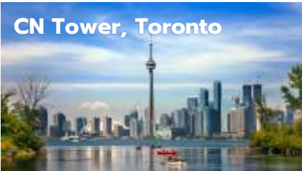
CN Tower, Toronto