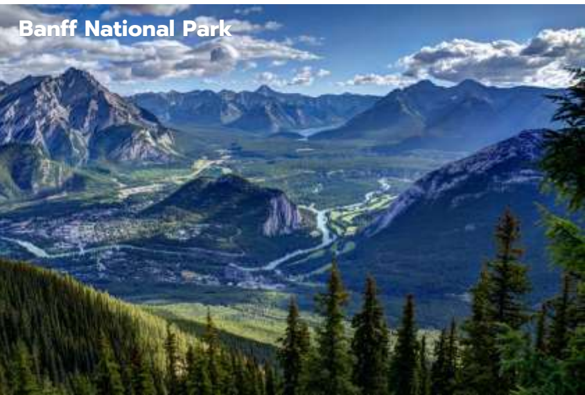
Banff National Park