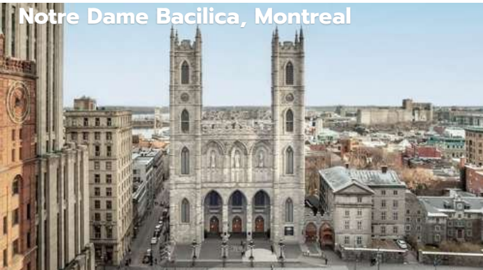
Notre Dame Basilica, Montreal