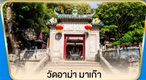
วัดอาม่า มาเก๊า