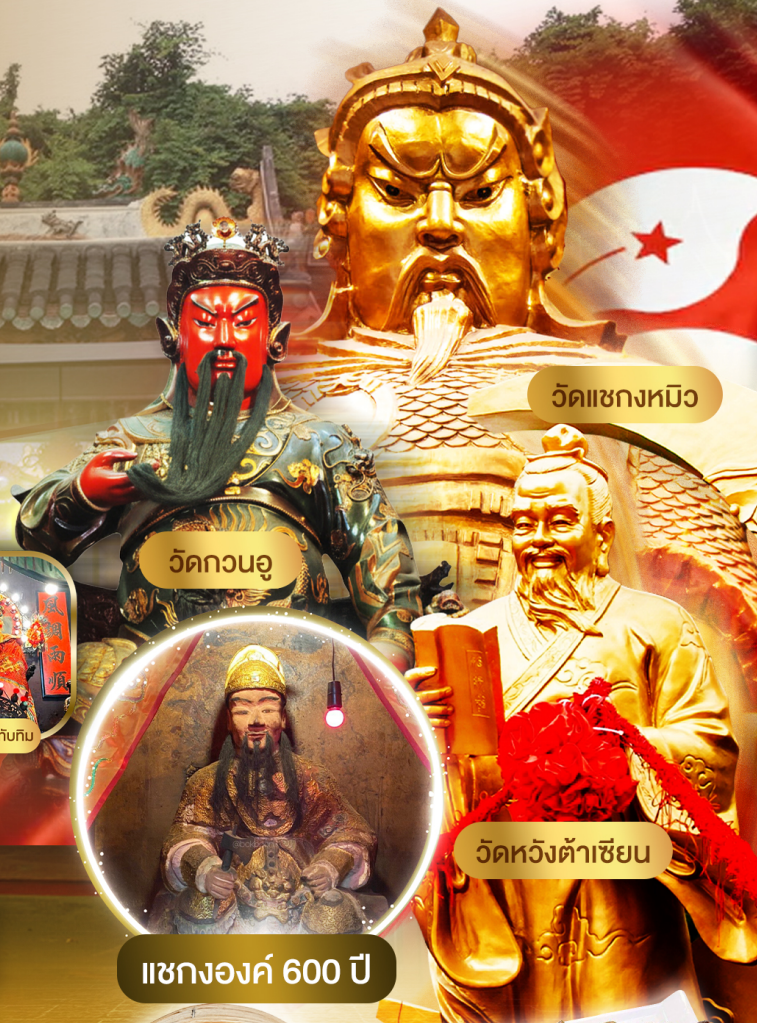
วัดเซกงหมิว