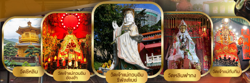
วัดซีหลิน