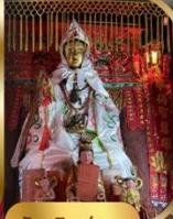
วัดหลินฟาง