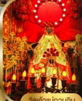
วัดเจ้าแม่กวนอิม ฮ่องซา