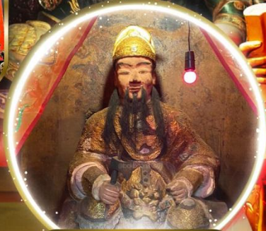
เซกงองค์ 600 ปี