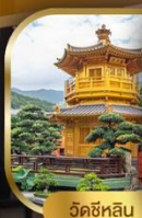
วัดชิลิน