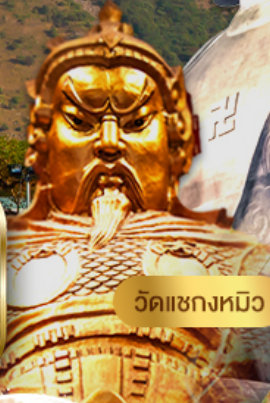
วัดแซกหมิว