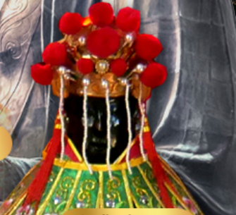
วัดเจ้าแม่กวนอิม อ่องฮ่า