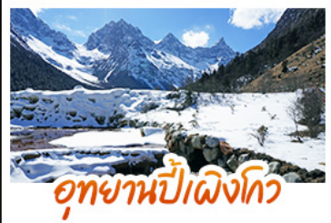
อุทยานปีศาจโกว

หมี่แพนด้านอนเซลฟ์ • สะพานโบราณหนานเฉียว • ภูเขาหิมะวางวู่ เมืองโบราณกวนเซี่ยน • อุทยานปีศาจโกว • อุทยานต่ากู่ปิงชวน ยอดเขาจ้อไบ๊ • วัดเป่ากั๋ว • ล่องเรือชมมรดกโลกหลวงพ่โตเล่อซาน วัดต้าเจี๋ย • ถนนไท่กู่หลี่ • ถนนซุนซีลู่ • ถนนโบราณชอยกวางชอยแพค