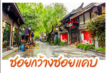
ชอยกวางชอยแพค