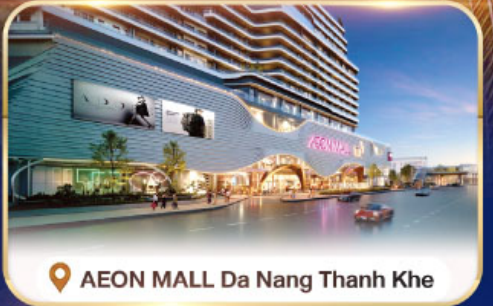
📍 AEON MALL Da Nang Thanh Khe