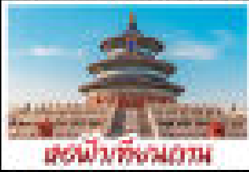
เขตม่านเทียนอันเหมิน

พระราชวังต้องห้าม - กองทัพแดง พิพิธภัณฑ์จีนชิงล่า - ไซเบอร์ - ราชพิธีชงชา