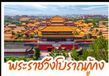
พระราชวังโบราณกู่กง