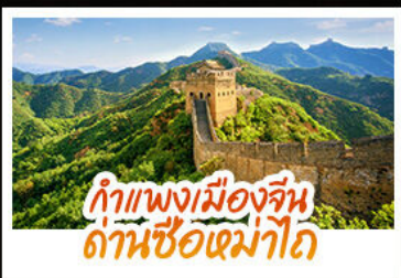
กำแพงเมืองจีน ด่านซื่อหม่าโต