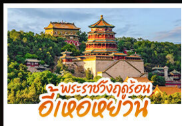
พระราชวังฤดูร้อน ฮ้อเจอเฉยวัน