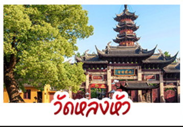
วัดเล่งเต๋อ