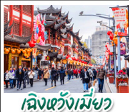
เฉิงเต๋อเหมินชว่