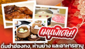
ส้มซ่าฮ่องกง, ห่านย่าง และอาหารชาบู

เดินทาง 10-12 ก.ค. 69 15-17 ส.ค. 69 17-19 ก.ค. 69 22-24 ส.ค. 69 08-10 ส.ค. 69 29-31 ส.ค. 69