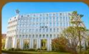
ย่านซองซู