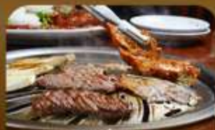
เมนูช่างสไตล์เกาหลี