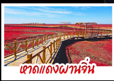
เดาดแดงผานจัน