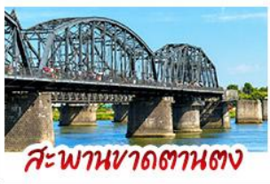
สะพานหวาดถานตง

2 มหัศจรรย์ธรรมชาติระดับโลก "หาดแดงผานจิน" คู่กับ "ถ้ำน้ำเป็นสี" ยืนมองฝั่งเกาหลีเหนือที่ตามอง • ชมความยิ่งใหญ่ของพระราชวังเส้นหยางกู่กิง