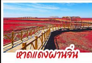
หาดแดงผานจิน