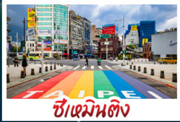
ซีเหมินตง