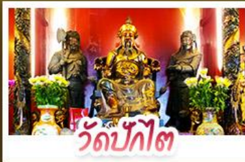
วัดปักโก๊ต