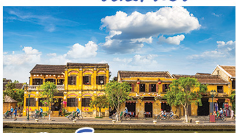
เมืองโบราณฮองอัน