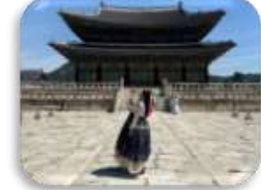
พระราชวังเคียงบก