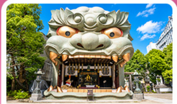
ศาลเจ้านัมบะ ยาชากะ