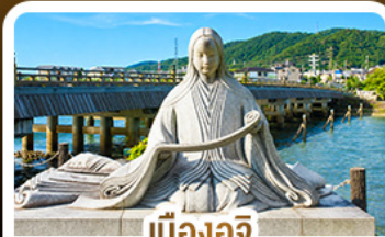
เมืองอูจิ สวรรค์คนรักชาเขียว