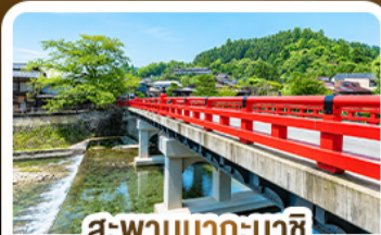
สะพานนากะบาชิ ทาคายาม่า