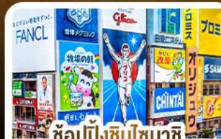
ช้อปปิ้งชินโซบาชิจิ และโดตงโบริ