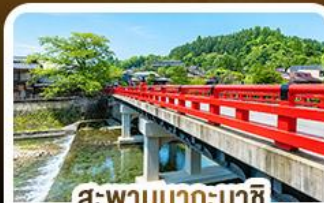
สะพานนากะบาชิจิ ทาคายาม่า