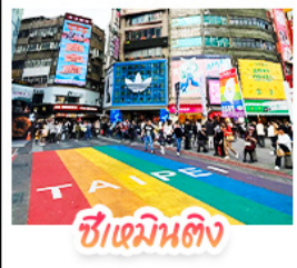
ซีเหมินตง