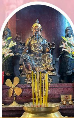
วัดปักไต้ฮ่องกง