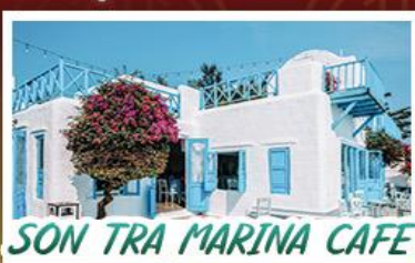
SON TRA MARINA CAFE

03 - 05 มี.ย.69 13,800 19 - 21 มี.ย.69 13,800 03 - 05 ก.ค.69 13,800 07 - 09 ส.ค.69 13,800 12 - 14 ส.ค.69 14,800