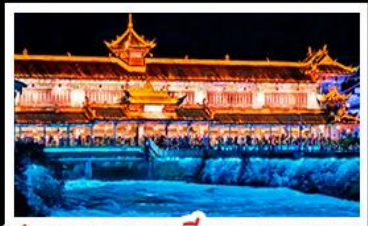
สะพานหนานเฉียวBLUE TEARS

สวนม่านฮวา - อุทยานหลุมฟ้าสะพานสวรรค์ ลี่ดรุณี - หงหยาดัง - รถไฟฟ้าทะเลตึก สะพานหนานเฉียว BLUE TEARS พักโรงแรมระดับ 4 ดาว - ไม่ลงร้านช้อปปิ้ง เมนูพิเศษ สุกี้หมาล่า เปิดปิกนิก