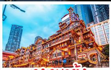
แสงฉายาตั้ง