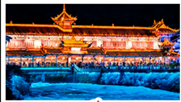
สะพานหนานเฉียวBLUE TEARS

สวนม่านฮวา - อุทยานหลุมฟ้าสะพานสวรรค์ สีดรุณี - หงหยาดัง - รถไฟฟ้าทะเลตึก สะพานหนานเฉียว BLUE TEARS พักโรงแรมระดับ 4 ดาว - โมลร้านช้อปปิ้ง เมนูพิเศษ สุกี้หมาล่า เปิดปิกนิก