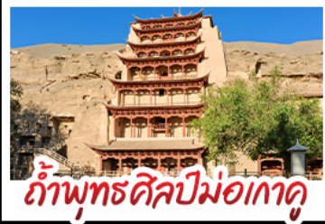
กำแพงพุทธศิลป์ม่อเถาคุ

มินิตรายครวญ - สระน้ำวังพระจันทร์ ทะเลสาบเกลือฉางท่า - กำแพงพุทธศิลป์ม่อเถาคุ หุบเขาสายรุ้งจางเย่ - ทะเลสาบชิงไห่